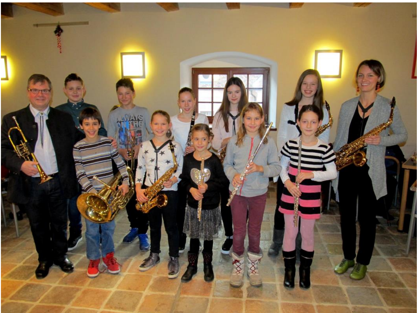
Adventfeier im Europahaus in Pulkau