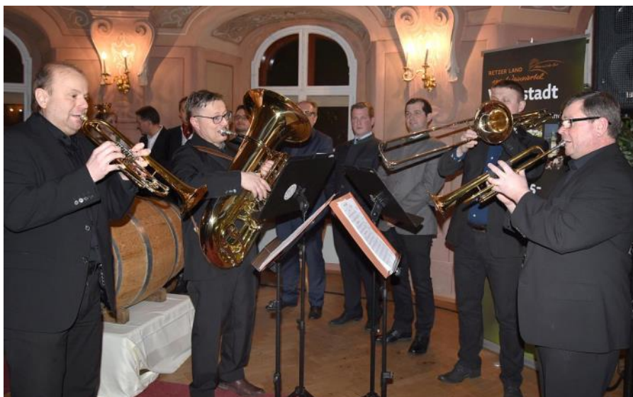
Musikalische Umrahmung der Segnung des „Retzer Stadtweines“

Das länderübergreifende Brassquartett musizierte u. a. bei der Segnung des Retzer Stadtweines und der Eröffnung des „Festival Retz 2018“.