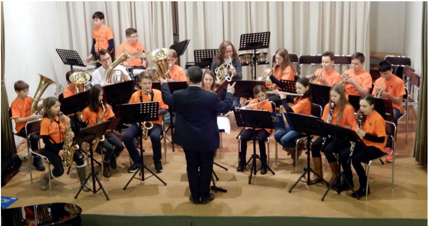
Am 23. Juni 2018 umrahmte die „Teeny Band“ die Feierstunde der Geburtstags- und Hochzeitsjubilare im Stadtsaal.