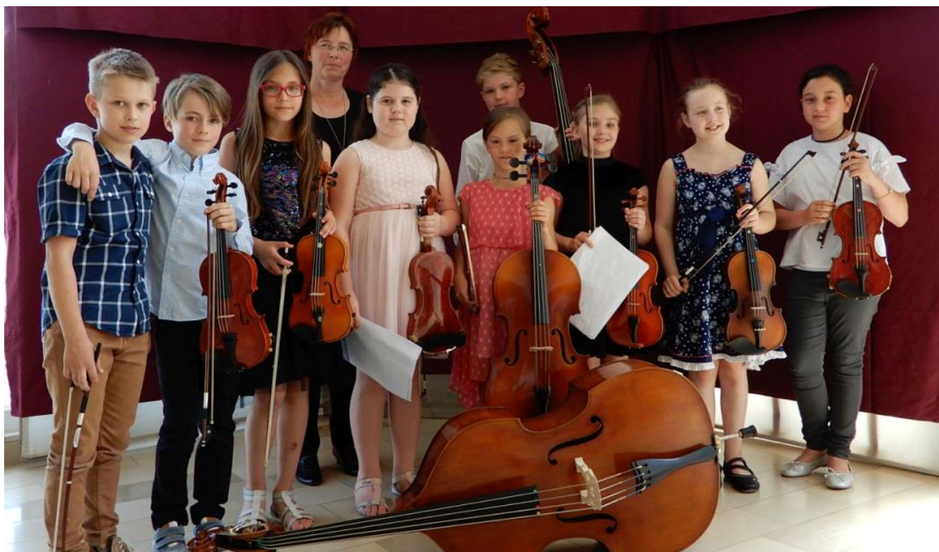
Das Vororchester „Ministrings“ des Musikschulverbandes Retzer Land erreichte einen „Sehr guter Erfolg“