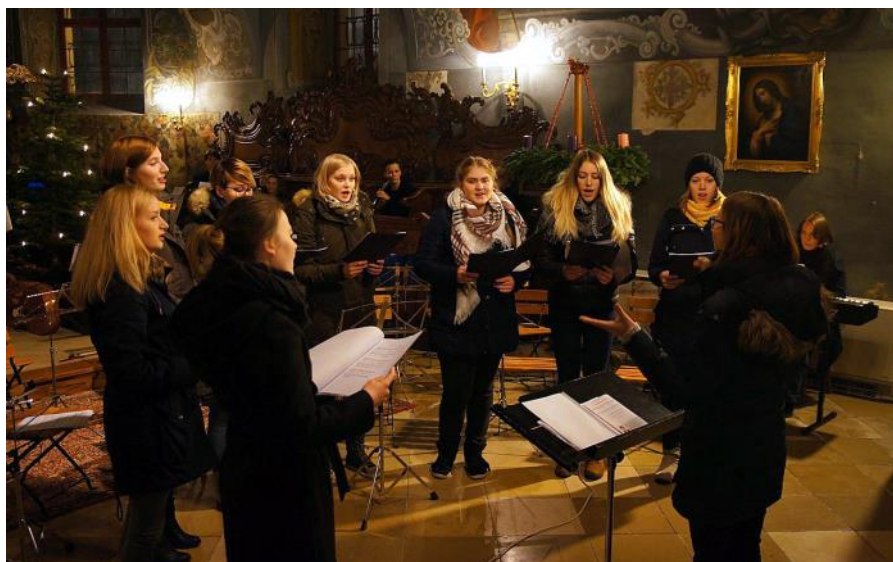
Der Jugendchor beim Adventkonzert in der Retzer Rathauskapelle

Anfang Jänner wurde uns die große Ehre zuteil, den Neujahrsempfang von Landeshauptfrau Mag. Johanna Mikl-Leitner im Althof in Retz musikalisch zu umrahmen. Un-