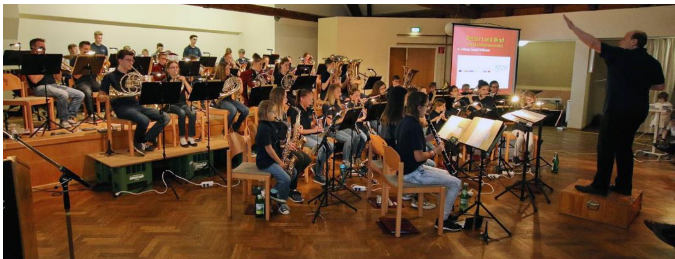
RETZER LAND WIND beim Gemeinschaftskonzert mit der Trachtenkapelle Unterretzbach im Althof Retz.