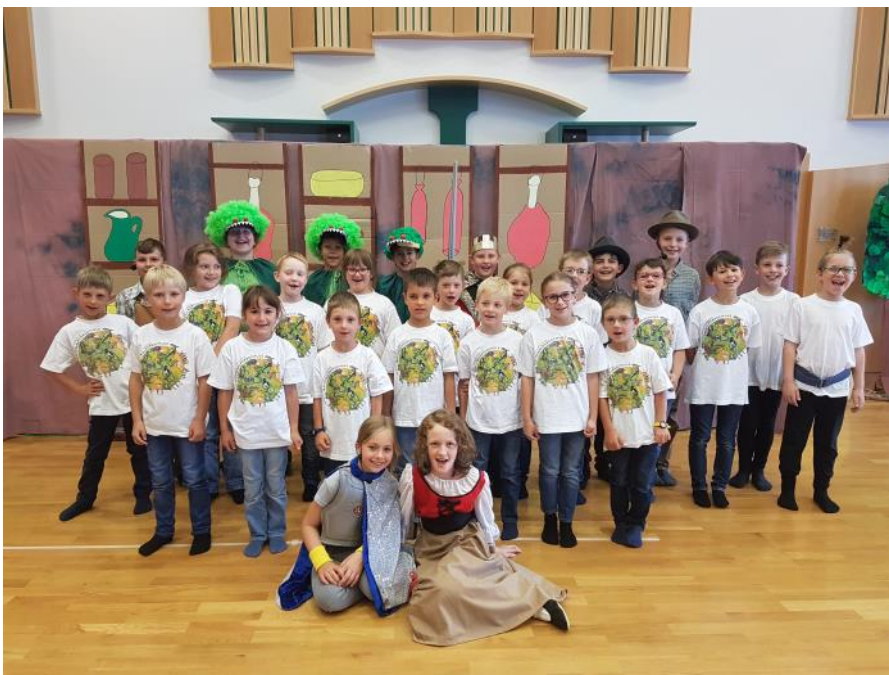
Schulfest in Pleissing