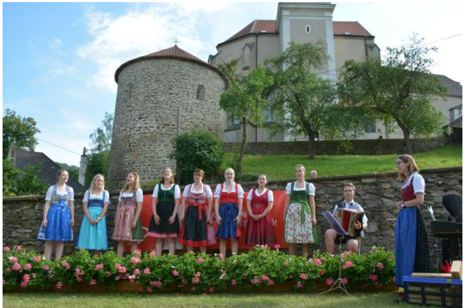
Der Jugendchor beim Sängerfest in Hardegg