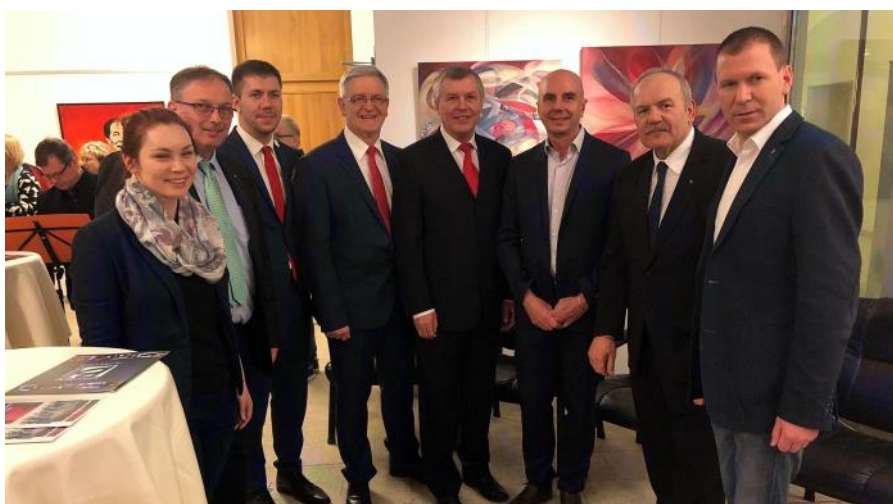
Ausstellung von Werken Znaimer Künstler