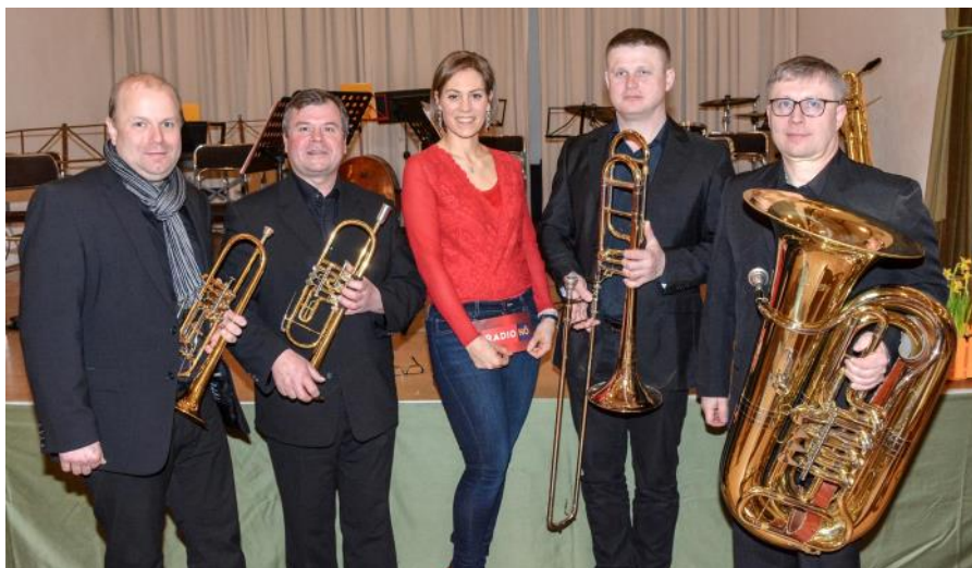
Benefizkonzert für das Europahaus Pulkau